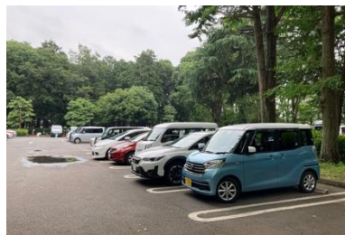
写真⑤ 駐車場の状況