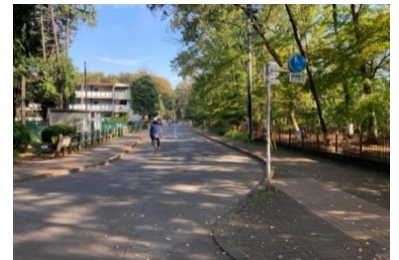
写真⑥ 駐車場周辺の道路状況