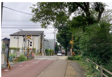
写真⑦ 敷地南側の道路状況