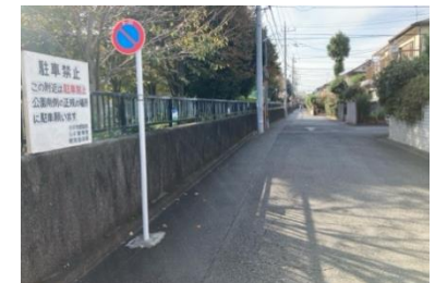
写真⑨ 中央公園北側通路の状況