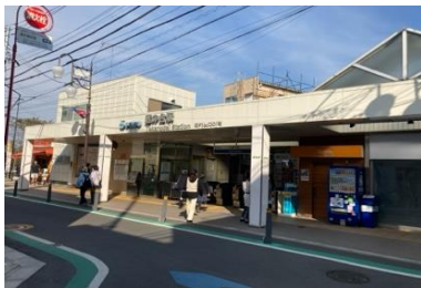
写真④ 鷹の台駅の状況