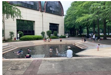
写真② じゃぶじゃぶ池周辺の状況