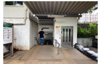
写真③ 鷹の台駅との接続状況