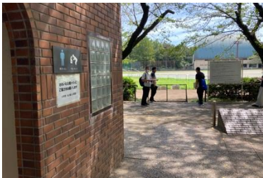
写真① トイレと入り口の状況