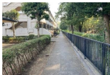
写真⑧ 都営住宅との間の通路