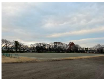
サッカー等実施エリアと陸上トラック