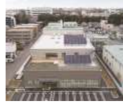
リサイクルセンター

主要設備：供給・搬送コンベヤ、破袋機・小袋破袋機、除袋機、磁選機、アルミ選別機、カンプレス機