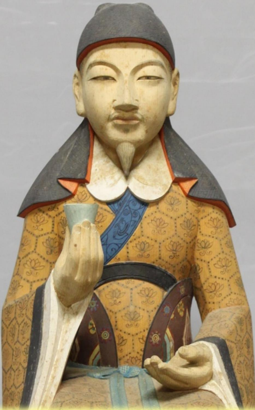
「六義歌」 りくせんか 平櫛田中作品の修繕（クラウドファンディングの実施）