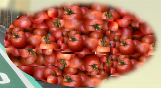
「梨、トマト」 農業経営基盤の強化支援 「道路」 通学路交通安全対策の充実