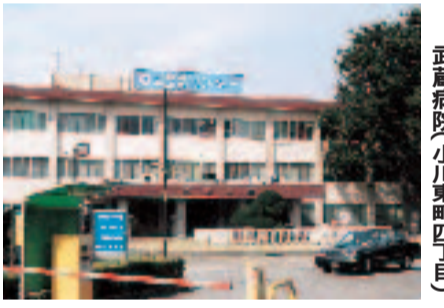
国立精神・神経センター武蔵病院(小川町四丁目)

めどがき 9月定例会では、代表質問において市が抱えるさまざまな課題を取り上げながら、希望ある将来の小平について活発な議論がされました。 議会事務局 1333番地 千187 8701 小平市小川町二丁目 議会編集委員会 1333番地 千187 8701 小平市小川町二丁目 議会事務局 1333番地 千187 8701 小平市小川町二丁目 〒044-2346(9566) 042(346)9566 042(346)9567