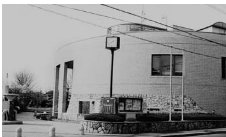
ふれあい下水道館

市道 小平市道占有規則で定められており、年4回開催される道路調整会議で協議、調整を行っている。舗装の分類に応じた掘削禁止期間が決められているが、道路管理者が認めるときはこの限りでない。埋戻しの基準は小平市道路占有工事要綱に明記されている。都道においても道路占有工事要綱に基づき、市と同様にしている。市として対応ができなかったもので、今後このようなことがないように密な調整を図っていききたい。