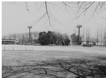
中央公園グラウンド

市道 小平市道占有規則で定められており、年4回開催される道路調整会議で協議、調整を行っている。舗装の分類に応じた掘削禁止期間が決められているが、道路管理者が認めるときはこの限りでない。埋戻しの基準は小平市道路占有工事要綱に明記されている。都道においても道路占有工事要綱に基づき、市と同様にしている。市として対応ができなかったもので、今後このようなことがないように密な調整を図っていききたい。