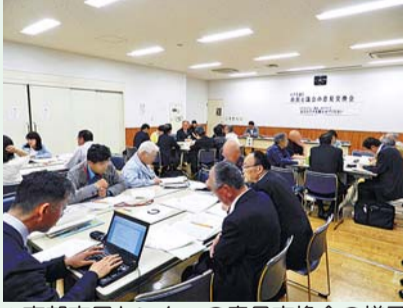
▲東部市民センターの意見交換会の様子

今後も市民の皆さんとの意見交換の機会を定期的に設けていきます。多くの方のご参加をお待ちしております。