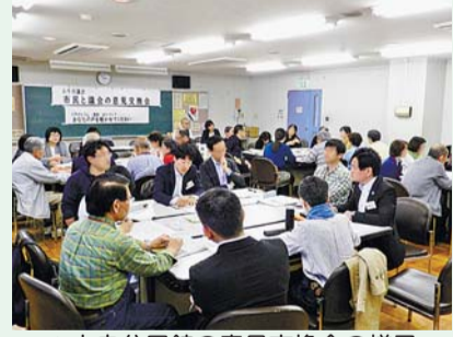
▲中央公民館の意見交換会の様子