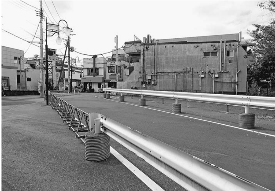
鷹の台駅北側のロータリー整備予定地前の道路