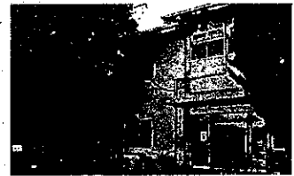
仲町公民館(昭和39年開館)

現在、公民館は中央館のほかに分館10館があります。公民館では、各種講座や講習会などを行っているほか、学習室などの貸し出しを行っています。