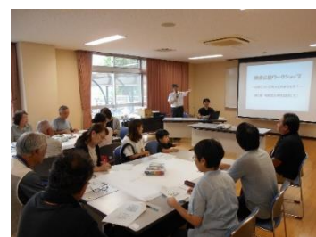
鎌倉公園ワークショップ

都市計画公園を整備することで、良好な都市環境が形成され、公園の活用機会が増加するほか、オープンスペース等の確保による防災面の強化などが期待できます。