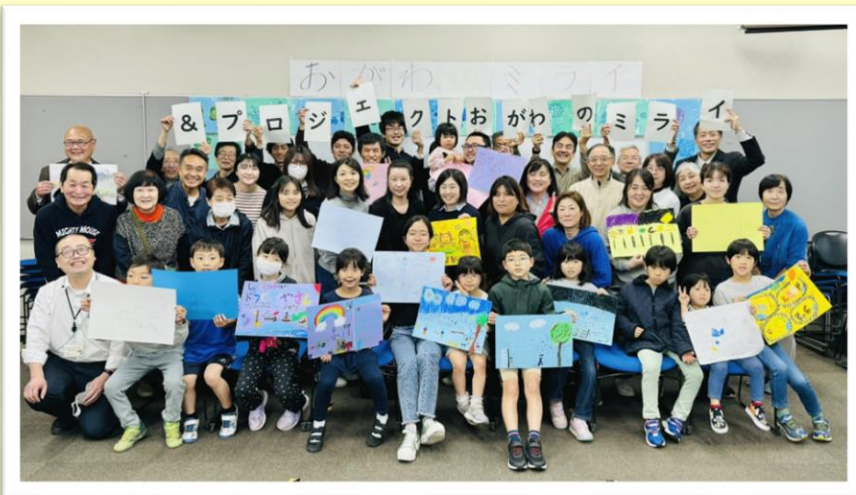
令和6年11月16日 イベント終了後の集合写真（職業能力開発総合大学校にて）