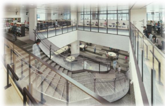
小川駅西口新公共施設 パース （吹き抜け部分イメージ）