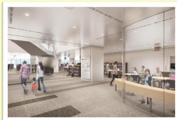
小川駅西口複合施設 パース （4階エントランス付近 イメージ）