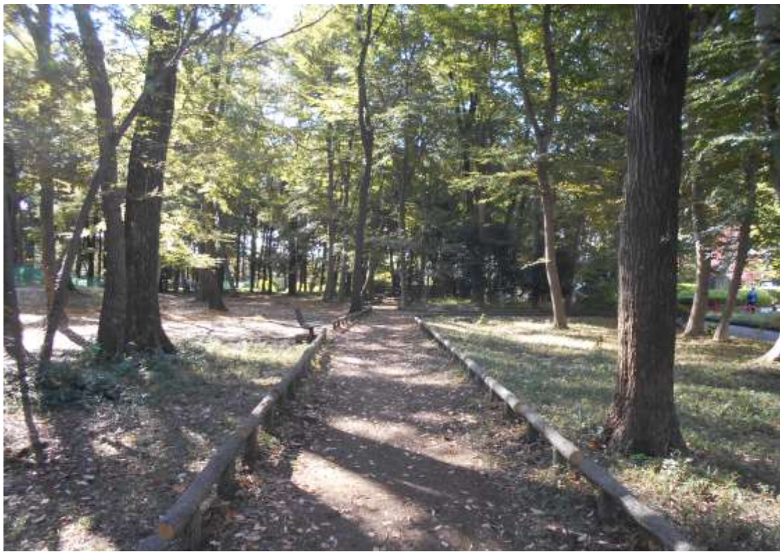
中央公園東側の樹林帯