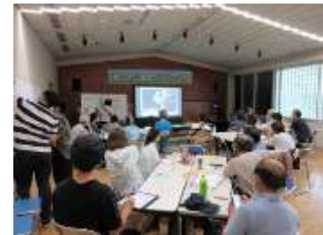
鷹の台公園いどばた会議

都市計画公園を整備することで、良好な都市環境が形成され、公園の活用機会が増加するほか、オープンスペース等の確保による防災面の強化などが期待できます。