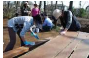
活動するアダプト団体

市民によるみどりの保全活動の推進、市民のみどりについての理解の向上が期待できます。