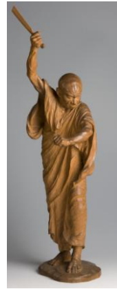
米原雲海《二祖》個人蔵

「日本彫刻会」は1907年(明治40)結成された日本で最初の本格的な彫刻団体です。同会は、岡倉天心(覚三)を会頭として、高村光雲の高弟・米原雲海と山崎朝雲をはじめ、平櫛田中、加藤景雲、森鳳聲、滝澤天友ら6名によって結成され、1910年代における彫刻界の一つの潮流を生み出しました。