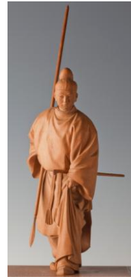
平坂芳文《伝・中大兄皇子》 個人蔵