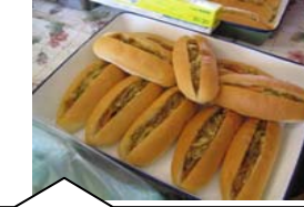
野菜たっぷりナラミドッグを開発