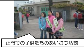
正門での子供たちのあいさつ活動