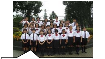
子供たちが楽しみにしているにじいろひろば