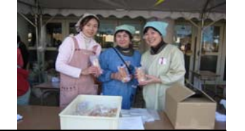
青少対まつりでも大好評でした