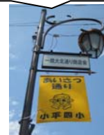
商店街に掲げたあいさつフラッグ