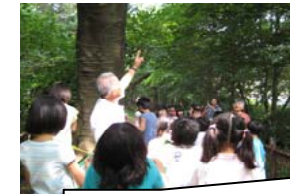
4年生の玉川上水ウォッチングはナラミスタッフの方々と一緒に1年間を通して春夏秋冬の玉川上水の学習をします

学校の南を流れる玉川上水の歴史や生き物に詳しい地域の皆さんが、ナラミスタッフとして各学年の授業を支援してくださっています。放課後子ども教室も活発です。にじいろひろば、よさこい、小さなおはなし会、ミニバス、花いっぱい、ナラミー教室、ほのぼのワールド、合唱団、竹とんぼ、剣道等々、今年度は年間300回を超えそうです。