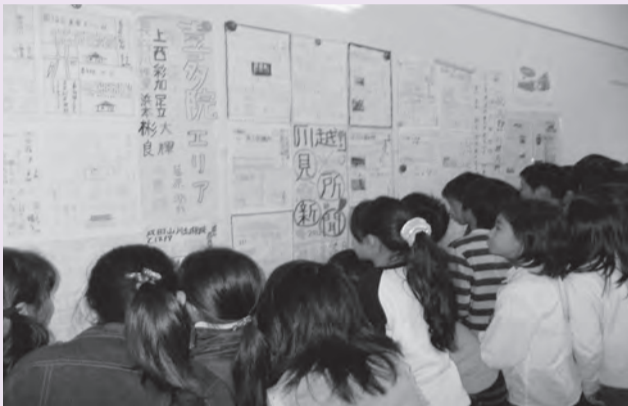
〈中学生の新聞に興味津々〉

キャリア教育推進の取組として、新聞作りの優れた手法を小平第七小学校、小平第十一小学校、小平第六中学校で共有しています。昨年度は、小平第七小学校の先進的な取組を小平第六中学校が学び、今年度は、校外学習の様子をまとめた小平第六中学校の作品を小平第十一小学校に紹介しました。