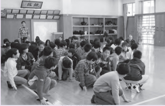
〈体験型学習の様子〉

キャリア教育推進の取組として、小平第一中学校区の三校が共通の講師を招いて、コミュニケーション能力を高めるための体験型学習(ワークショップ)の手法を用いた授業を行っています。学校内だけでなく、小平第十四小学校と学園東小学校の6年生が、小平第一中学校を会場に、合同で行う機会も設定します。