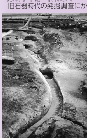
(見つけた水路のあと)

鈴木遺跡の発掘調査は、今から40年前の昭和49年(1974年)に、鈴木小学校を建てる工事に本格的に始められました。そのきっかけとなったのは、江戸時代から明治時代に、玉川上水から引いた水で動いていた水車のあとでした。