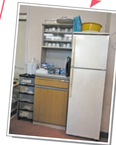
⑤冷蔵庫・食器棚・電気ポット