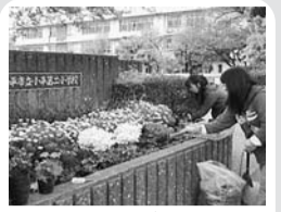
○花壇の整備などの環境支援