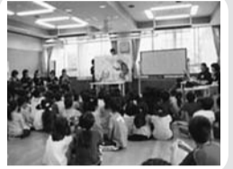
○読み聞かせや図書室の整備などの図書活動支援