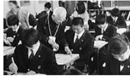
○授業のアシスタント、実技の補助などの学習支援