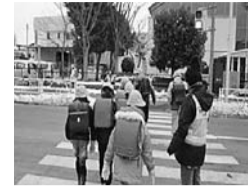
○登下校や社会科見学・遠足などの見守り支援