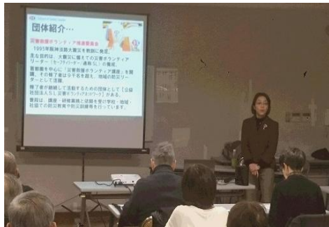
「地域の防災ははじめの一步」

防災部会では、これまでに二回の会合を行い、各団体の取組の情報提供と、部会の進め方や方向性について議論が行われました。その中で、まずは地域連絡会の中で「地域の防災」をテーマに講習会を開催することで、地域防災の基本を学び、講習会を通して、意識を高め、地域内の各団体の情報と課題を共有することになりました。