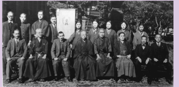
税金が完納されて表彰された時の記念写真(昭和15年2月11日)