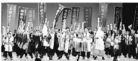
小平よさこいスクールダンスフェスティバル