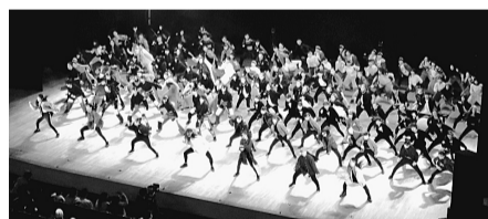
多摩六都ヤング・ダンスフェスティバル

共通 申込み 当日会場へ(入場無料) ところ ルネこだいら大ホール ※駐車場はありません。 問合せ 地域学習支援課 ☎042(346)9834