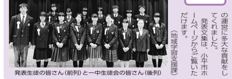
発表生徒の皆さん(前列)と一中生徒会の皆さん(後列)

1月9日(火)にルネこだいらホールで開催され、市内中学校9校の代表生徒が、それぞれの考えを自分の言葉で発表しました。 また、当校の小・中連携教育の紹介を行い、発表会を通じて、各校との連携に多大な貢献をしてくださいました。 発表文集は、小平市ホームページからご覧いただけます。 地域学習支援課