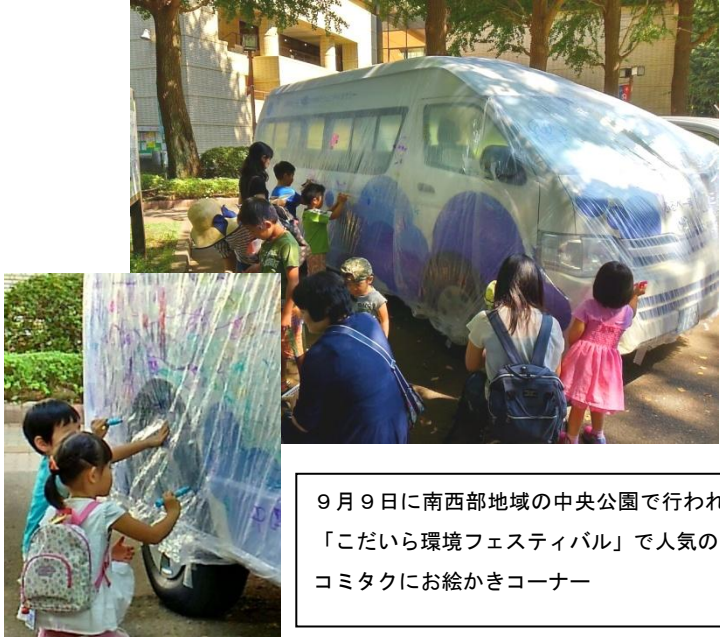
9月9日に南西部地域の中央公園で行われた 「こだいら環境フェスティバル」で人気の コミタクにお絵かきコーナー

平成28年5月に発足した「小平南西部 地域コミュニティタクシーを考える会」 で、地域の生活交通について検討していま す。 月1回の会議では、鷹の台駅西側地域、 上水本町地域をそれぞれ循環する2つの ルート案が出されています。 今後は、各ルートの課題の整理や停留所 の設置場所など、実証実験運行に向けて、 検討を進めていきます。