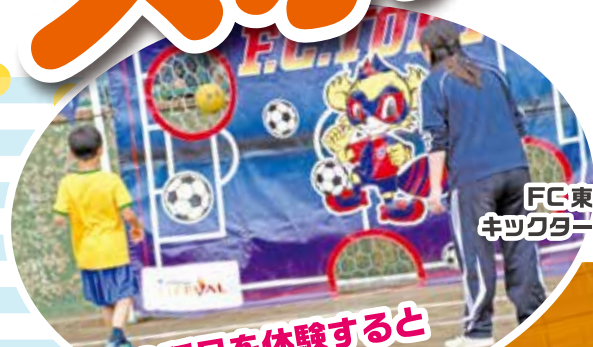
FC東京 キックターゲット