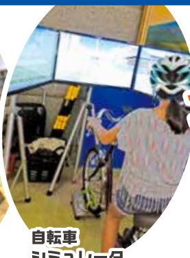
自転車 シミュレータ