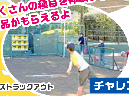
ストラックアウト