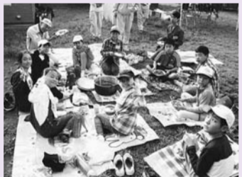
(みんなで楽しくキャンプ!)

青少年委員が企画・運営するこの講座は、年間を通じて開催され、キャンプやレクリエーション、郷土学習などを通して、地域で活躍する青少年リーダーを育てることを目的としています。