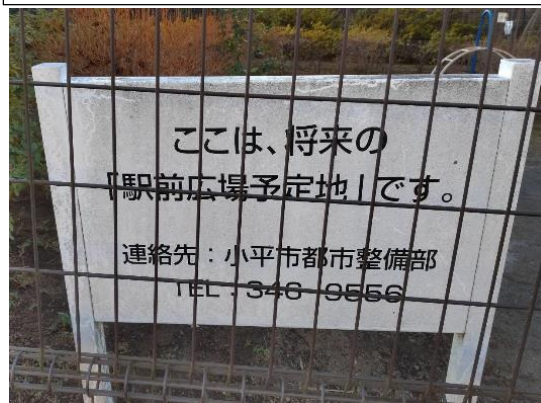
＜写真①＞駅前広場予定地に設置されている看板

※駅前広場整備の際に、サクラが工事範囲にかかることとなるため、根の一部を切る必要があります。根の切断は直上の枝にも影響することから裂傷枝と合わせて1月中旬に剪定を行いました。