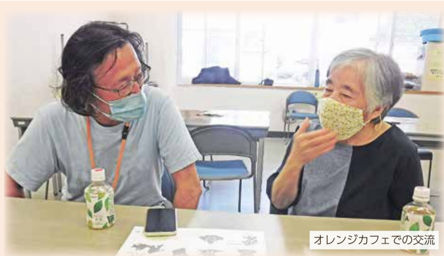
オレンジカフェでの交流