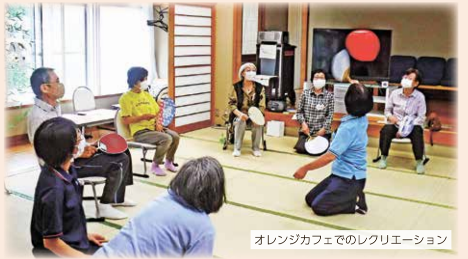
オレンジカフェでのレクリエーション