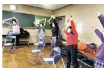
地域の通いの場での運動の様子

さまざまな交流の場があります。詳しくは、地域包括支援センターにお問い合わせください。