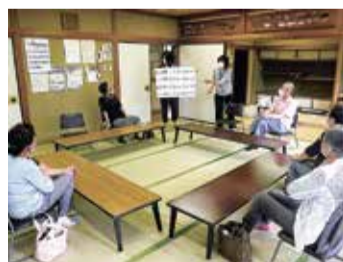
オレンジカフェでの交流の様子

認知症について関心がある方、物忘れが心配な方も参加できます。詳しくは、高齢者支援課や地域包括支援センターにお問い合わせください。