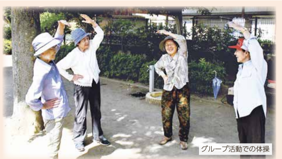
グループ活動での体操