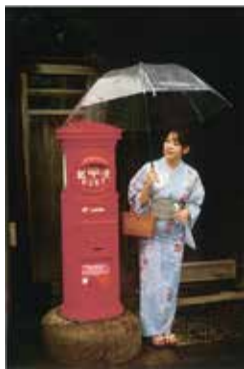
金賞「雨宿り」