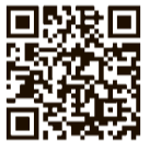
多摩六都科学館 ユーチューブチャンネル