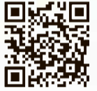
デジタルスタンプラリー アンケートフォーム

問合せ 小麦の香る街小平PRイベント連携協議会事務局 ☎080(6014)2474 (平日午前10時~午後5時30分)