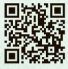
交付窓口 予約システム