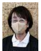
永友さん 主な仕事 …清掃作業

友人がシルバー人材センターで働いていて、自分も働いてみたいと思い、登録をしました。