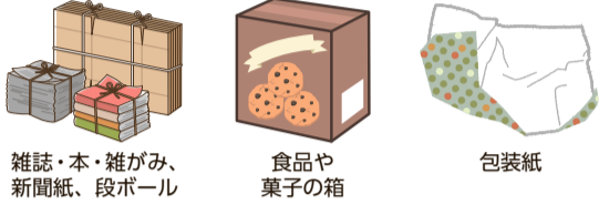
雑誌・本・雑がみ、新聞紙、段ボール