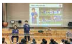
小学校訪問の様子