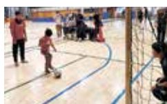
市民スポーツまつりでのブラインドサッカー体験コーナー

市では、NPO法人日本ブラインドサッカー協会と連携し、ブラインドサッカー体験会や代表練習見学会の実施、小学校での体験型の教育プログラムであるスポ育®の実施など、パラスポーツ推進のため、さまざまな取り組みを行ってきました。令和7年3月17日には、これまでの協力関係を一層強化し、発展させるため、包括連携に関する協定を締結しました。