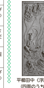
平櫛田中『浮彫天部像(四面のうち一面)』

特別児童扶養手当 (ID3925) 対 次のいずれかに該当する20歳未満の児童を監護または養育している方 ▽身体障害者手帳1～3級(下肢障害については4級の一部を含む) ▽愛の手帳おおむね1～3度 ▽右記と同程度の疾病もしくは身体または精神の障がいがある ※診断書判定により対象外となる場合もあります。 児童扶養手当 (ID3752・児童育成手当(育成手当) (ID3757)) 対 次のいずれかに該当する18歳到達後最初の3月31日までの児童を養育している方 ▽父母が離婚(事実婚の解消を含む) ▽父母が離婚(事実婚の解消を含む) ▽父母が離婚(事実婚の解消を含む) ▽父母が離婚(事実婚の解消を含む)