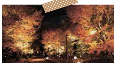
いつもと違う雰囲気 萩山公園ライトアップ