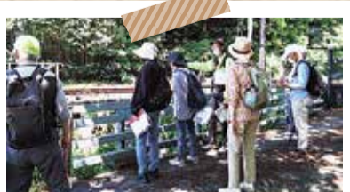
8面で参加者募集中 まち巡りガイドツアー

ほかにも、世界手打ちうどん選手権大会や小平フォト五七五コンテストなどのイベントを開催し、多くの方に楽しんでいただきました。