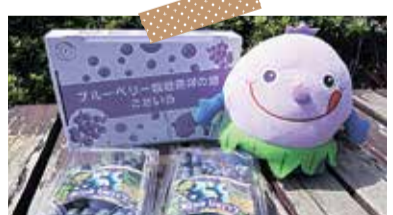
ブルーベリーの皮を使用した箱で販売 ブルーベリーまつり