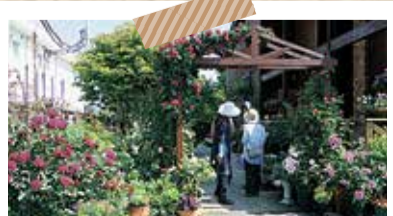
23か所の個人の庭などを公開 オープンガーデン