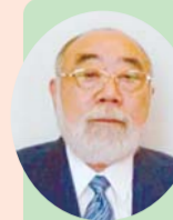
小平市国際交流協会理事長

今後とも、市民と外国人の皆さんとの交流の輪が広がり、大きくなるよう努力してまいります。皆さんの暖かいご支援を心からお願い申し上げます。