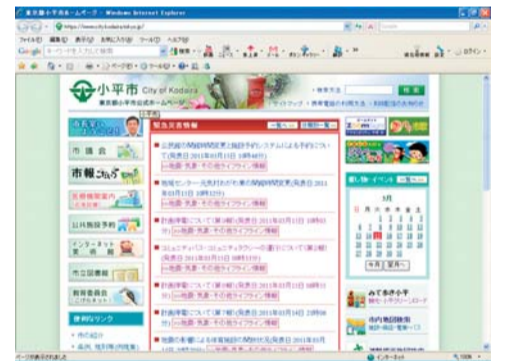
小平市ホームページ緊急災害用トップ画面