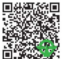
携帯電話用ホームページ(二次元バーコード)

※パソコンの場合は、小平市ホームページの「こだいらNEWS(小平市メールマガジン)」から配信登録を行ってください。