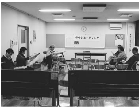
平成24年度のタウンミーティングの様子

6月30日開催 各地区では、自治会長や民生委員を知らない人が多いが、特に自治会を拒絶しているわけでもない。各自治会を取りまとめるような組織があればよいと思われる ▽お年寄りの憩いの場として、また自治会のよりどころとして、自治会の集会所があればよいと思う ▽中宿地区では、お金を集めて集会所を作り、修理しながら使っている ▽民生委員は、一人で6百人の世帯を受け持ち、高齢者、障がい者、児童の問題を取り扱っている。自治会のみで頼るのではなく、近所の人が