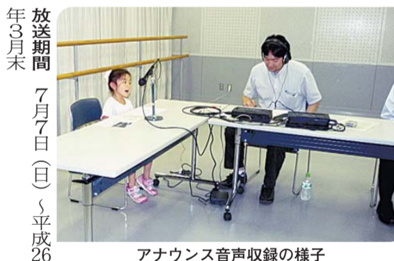
アナウンス音声収録の様子

利用時間・料金など 右表のとおり ※小学3年生以下は、親または成年の保護者の付き添い(1人につき子ども2人まで、水着を着用)が必要です。 ※グループ・団体での来場は事前にご連絡ください。