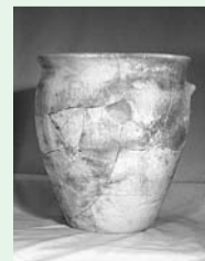
八小遺跡出土の甑