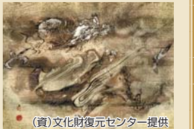
再現された龍の図(非公開)

五日市街道と小金井街道の交差点の北西にある海岸寺は、元文元年(1736年)に武蔵国秩父郡三峯山より引寺された臨済宗妙心寺派のお寺です。総檜造りの山門は、近隣に類を見ない美しい曲線の葺甲をもつ切妻型の茅葺屋根で、本柱の前後に控柱をもつ四脚門です。これらは鎌倉時代の建築様式を取り入れているといわれ、建築年代は不明ですが天明三年(1783年)の本堂建立の後、鈴木新田の長谷部大工の家に寄ぐうしていた渡大工の作とも伝えられています。天井板に描かれていた龍の姿は、すっかり薄れていましたが、近年のデジタル技術によって往時の姿の再現が試みられています(小平市有形文化財第7号)。