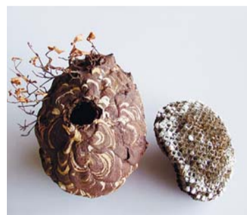
スズメバチの巣(左) アシナガバチの巣(右)

なお、事業完了に伴い、小川町一丁目土地区画整理組合は平成26年4月22日の都知事の認可をもって解散となりました。 問合せ 地域整備支援課 ☎042(346)9558