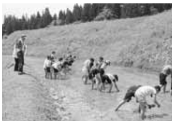
6月の田植えの様子

小学3年生～中学生 指導 亜細亜大学陸上部 技術監督・選手 主催 小平市教育委員会 申込み 9月14日(金)まで(必着)に、所定の申込書を問合せ先へ(送付可、小学生は保護者の承諾印が必要です) 問合せ 体育課(〒187-0025 津田町一丁目1番1号 市民総合体育館内) ☎042(343)1611 日帰り稲刈り体験ツアー 6月に「田植え体験ツアー」で植えた稲が元気に育っています。この稲の刈りに取りに、参加しませんか。 とき 9月30日(日) 集合 午前6時45分、市役所正面玄関前 ※解散は午後6時(予定)、