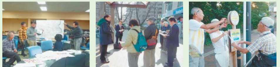
「小平南東部地域コミュニティタクシーを考える会」の活動の様子

地域で利用される交通になるよう、課題改善やサービスの向上を目指して、今後も検討を続けていきます。