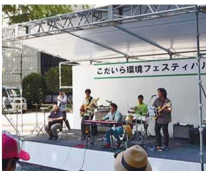
昨年のステージの様子