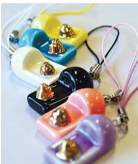
金うんトイレストラップ

◆うんち大研究 うんちはどこからやってきて、どこへ行くのかな。ウンディー探検隊と実験やクイズを通して下水道を学びます。 ◆うんち大研究