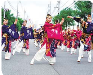
ダンスパレード 午前10時30分出発