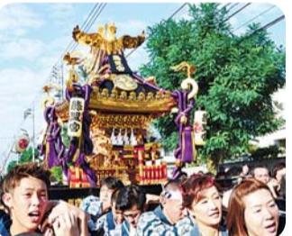
大人みこし 午後1時出発