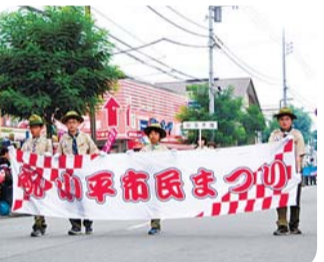
パレード 午前11時50分出発