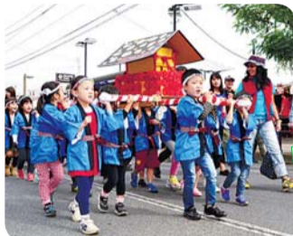
子どもみこし 午前10時出発