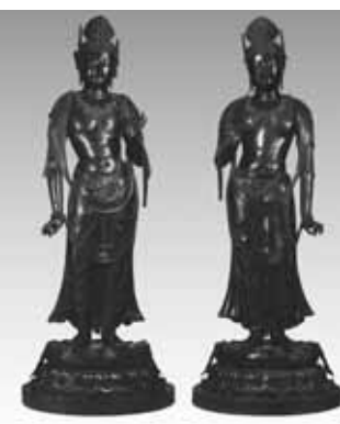
(左) 国宝 月光菩薩立像、(右) 国宝 日光菩薩立像

教育委員会では、東京国立博物館・平成館で3月25日(火)から6月8日(日)まで開催される、平城遷都千三百年記念「国宝薬師寺展」に関連した講演会を開催します。 とき 4月13日(日) 午後2時～4時