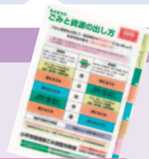
ごみと資源の出し方

市では、さらなる減量のために「ごみと資源の出し方」や「分別をよりわかりやすく」などの冊子をご活用していただきたく、市役所、東部・西部出張所で配布しています。ぜひ、ご活用ください。