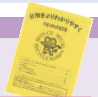
分別をよりわかりやすく

小平市ごみ処理基本計画(改訂)は、市政資料コーナー(市役所1階)、東部・西部出張所で閲覧できます。また、小平市ホームページでもご覧になれます。なお、市政資料コーナー、東部・西部出張所では販売もしています(1冊1,000円)。