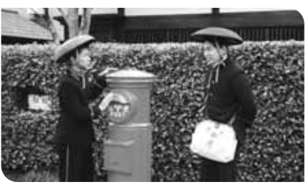
2008年3月小平ふるさと村のイベントの様子

市内には、今でも丸ポストが30基あり、都内で一番多く残され、皆さんに利用されています。その活躍ぶりを探索・紹介してください。