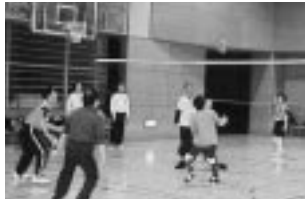
インディアアカ指導 講師 インディアアカ指導

対象 市内在住・在勤・在学の方 定員 30人 費用 無料 場所 旧小川東小学校体育館