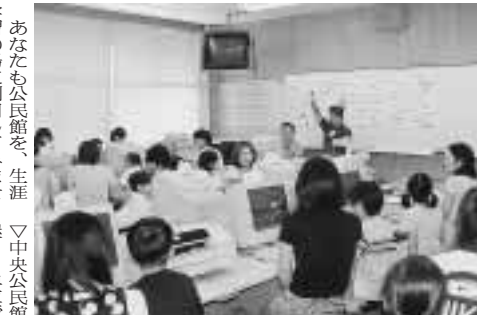
あなたも公民館を、生涯学習の場として利用してみませんか。